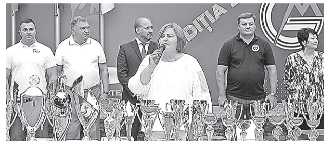
«Члены профсоюза подтвердили » с.5 свой высокий спортивный уровень»