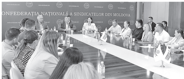
Профсоюзная школа Молдовы: » с.4 десятый выпуск