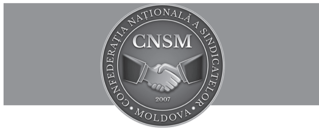
PUBLICAȚIE PERIODICĂ A CONFEDERAȚIEI NAȚIONALE A SINDICATELOR DIN MOLDOVA