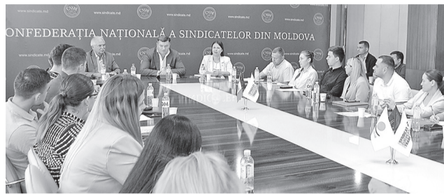
Școala Sindicală din Moldova, la a X-a ediție