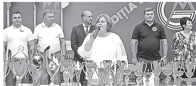
„Sindicaliștii au demonstrat că pot concura la cel mai înalt nivel sportiv”