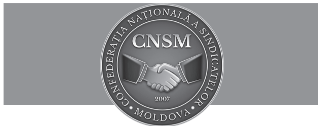
ПЕРИОДИЧЕСКОЕ ИЗДАНИЕ НАЦИОНАЛЬНОЙ КОНФЕДЕРАЦИИ ПРОФСОЮЗОВ МОЛДОВЫ