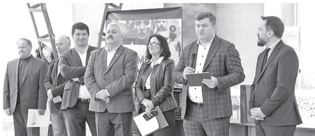
Безопасность труда – на первом месте на цементном заводе в Резине >> с.3