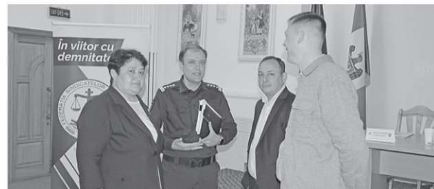
Профсоюз «Demnitate» определил приоритеты на следующие годы >> с.4