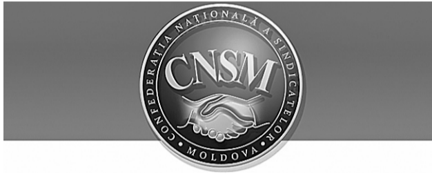
ПЕРИОДИЧЕСКОЕ ИЗДАНИЕ НАЦИОНАЛЬНОЙ КОНФЕДЕРАЦИИ ПРОФСОЮЗОВ МОЛДОВЫ