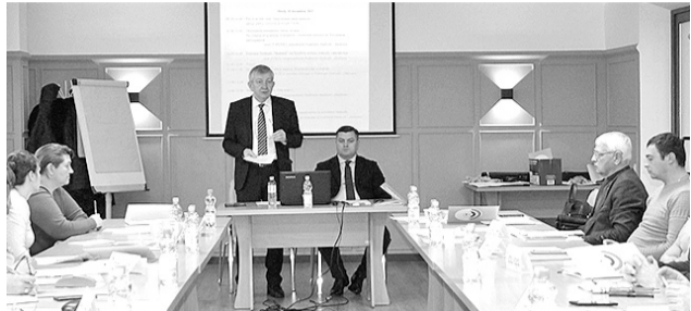
Федерация «Sănătatea» наметила ряд задач на будущее >> с.2