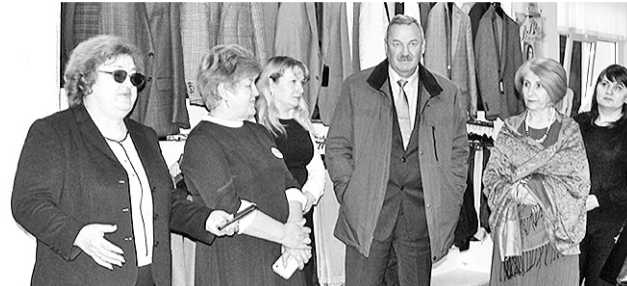
Меры поддержки целесообразны и уместны, но их недостаточно >> с.7