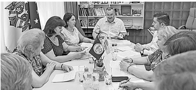
Обучение – процесс, который постоянно совершенствуется >> с.3