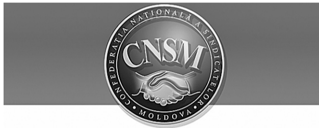
ПЕРИОДИЧЕСКОЕ ИЗДАНИЕ НАЦИОНАЛЬНОЙ КОНФЕДЕРАЦИИ ПРОФСОЮЗОВ МОЛДОВЫ