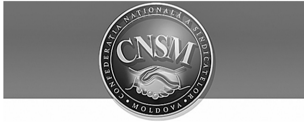
ПЕРИОДИЧЕСКОЕ ИЗДАНИЕ НАЦИОНАЛЬНОЙ КОНФЕДЕРАЦИИ ПРОФСОЮЗОВ МОЛДОВЫ