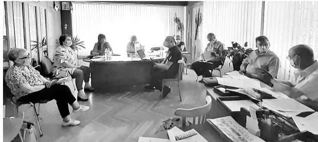
Меры по смягчению воздействия COVID-19 на членов «Agroindsind» >> с.3